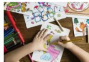
Sud Roussillon lance 2 concours de loisirs créatifs pour occuper vos enfants