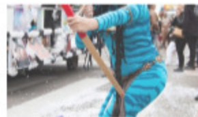
Saint-Cyprien : Les animations du mois de mai 17 avril 2015 à 14h42 Dans "Loisirs"