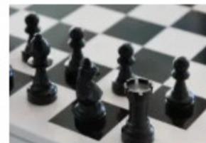
Les Rois de la Têt se déploient en ligne pendant le confinement