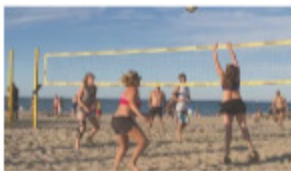
Saint-Cyprien : cet été, chacun son pass ! 28 juin 2018 à 18h46 Dans "Loisirs"