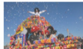
« A Saint-Cyp, Venez faire le plein de loisirs ! » 24 mars 2015 à 15h18 Dans "Loisirs"