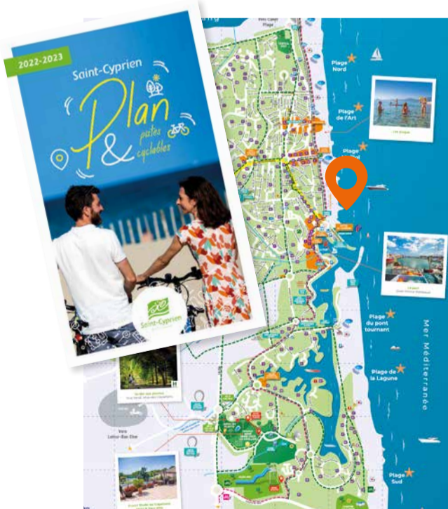
Saint-Cyprien: Mapa y carriles bici