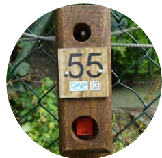
Balise à trouver